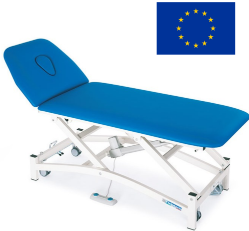
Table Elettra 2 (190 x 65/80 cm)

Découvrez la Table Elettra 2 , un équipement professionnel à 2 plans réglable en hauteur de manière électrique , idéal pour les traitements , les massages et les examens médicaux . La structure de la table permet l'approche du lève-personne, offrant ainsi une grande polyvalence d'utilisation. La table est disponible en deux options de largeur : 65 cm et 80 cm , pour répondre aux besoins spécifiques de votre pratique.